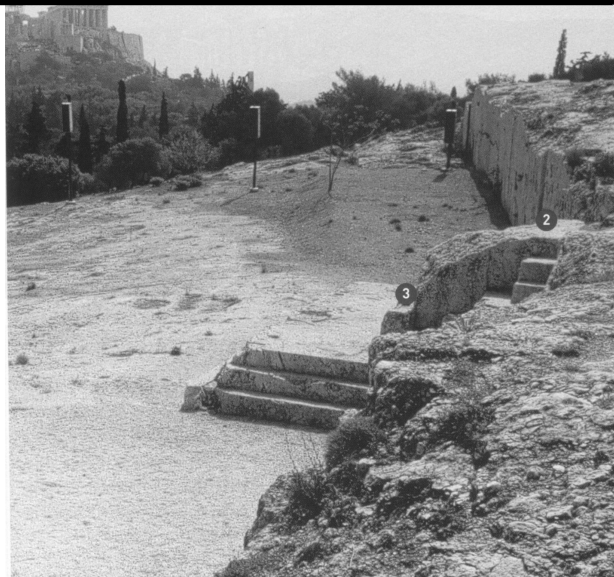
La colline de la Pnyx (le « lieu serré » en grec) où se réunit l'ecclésia.

Aristophane, Les Acharniens , 425 av JC traduction V-H Debidour